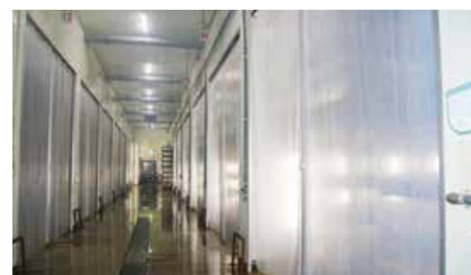
徹底管理された無菌質で製造