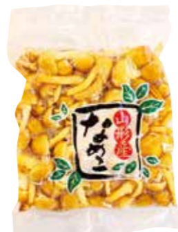
高品質が自慢の製品