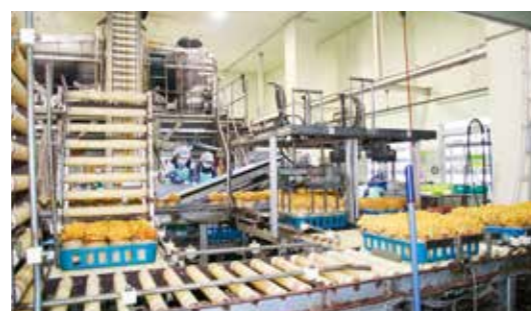
大規模設備により効率化を図る