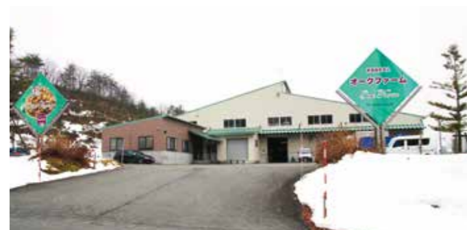
2019 JGAP 認証取得工場