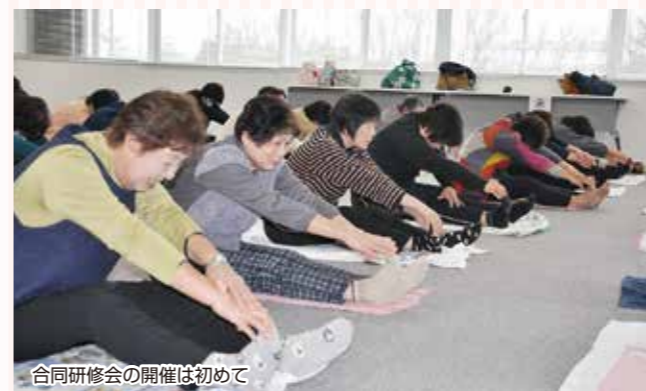
合同研修会の開催は初めて