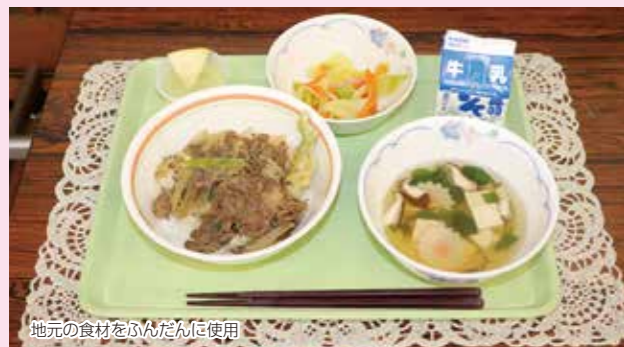
地元の食材をふんだんに使用

今後も当JAでは子ども達に「食の大切さ」の理解を深めてもらうため、食農教育を実施してまいります。