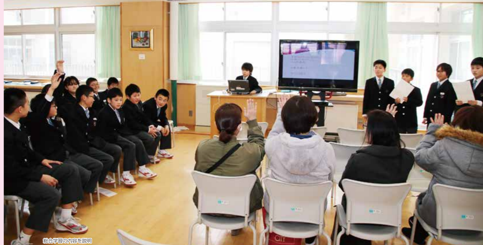
総合学習の内容を説明