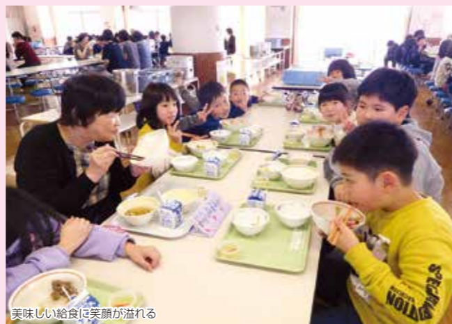
美味しい給食に笑顔が溢れる