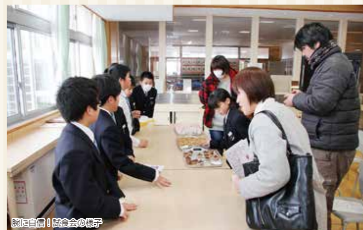
腕に自信! 試食の様子

この日の発表会では、研究グループごとに地元で取れる野菜を使ったレシピの発表や、地域農業の歴史や現在の取り組みなどを手作りで制作したパネルやパソコンを使い学習成果発表を行いました。また、地元のラズベリーを使用したジュースや里芋の田楽などの試食も行い、来校した保護者や農家の方々に大好評でした。