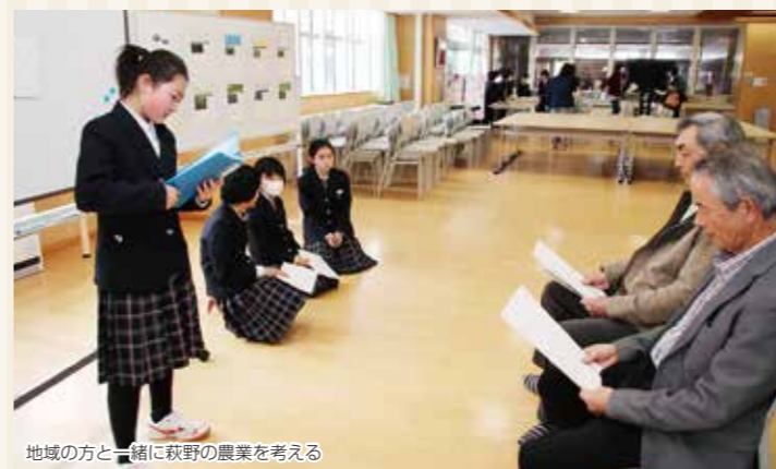
地域の方と一緒に萩野の農業を考える