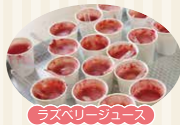
ラズベリージュース