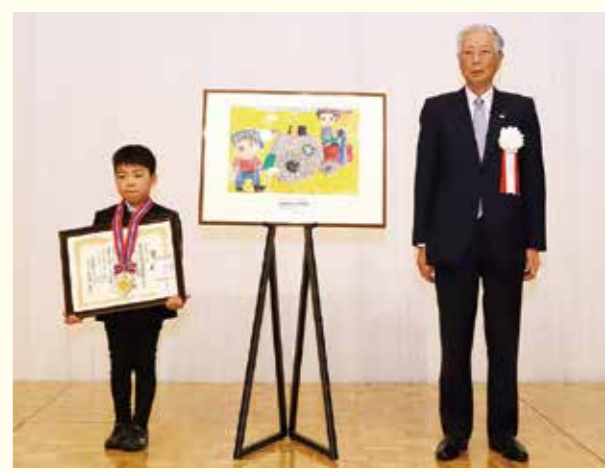
▲作品と共に記念撮影