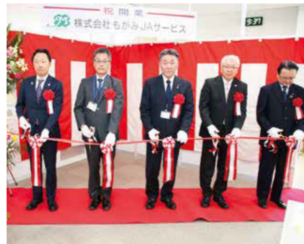
4月1日、子会社事務所に設立開業式が行われました