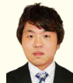
鮮川管農センター 購買課購買係