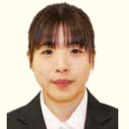
最上支店 金融課金融係