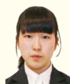
真室川支店 共済課共済係