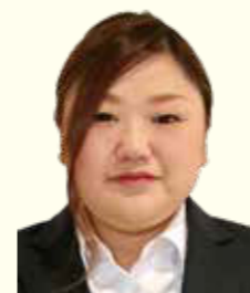
戸沢支店 金融課金融係

4月より4名の新規採用職員が入組いたしました。 組合員の皆さまに親しまれる職員を目指し 頑張りますのでよろしくお願いいたします。