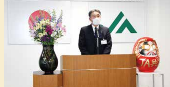
令和2年度 総合事業推進大会

令和2年度事業の目標達成に向けたJAおいしいもがみ事業推進大会が4月20日から24日の期間に、全職員を対象に各支店・営農センターにて開催されました。「農業所得の増大」「農業生産の拡大」「地域の活性化」を実現するため、組合員や地域の皆様方とともに農業が継続できるよう、持続可能な総合農協としての体制強化を図り、積極的に推進運動を展開することを確認しました。 持続可能な総合農協として体制強化を図る