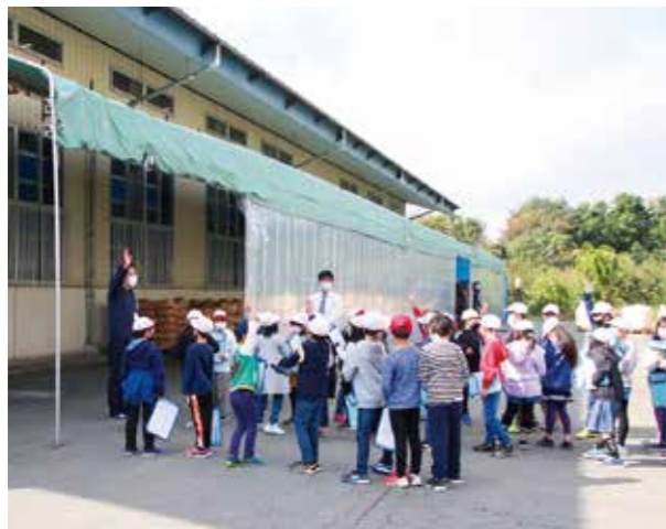
米低温倉庫を見学

10月20日、舟形小学校3年生児童33名が、南部営農センター米低温倉庫とねぎ選果場を見学を訪れ、地元の農業についての理解を深めました。児童はJA職員より施設の説明を受け、米倉庫に積まれた膨大な米袋に驚きの表情を見せていました。