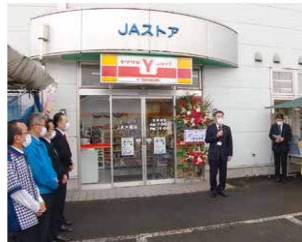
26日に行われたオープニングセレモニー

7月下旬の記録的な大雨で被害を受け営業を休止していた大蔵営農センターのYショップが、約3か月ぶりに営業を再開しリニューアルオープンしました。10月26日には関係者を招きオープニングセレモニーが行われ、2日間オープンセールで待ちかねた多くのお客様が来店されました。