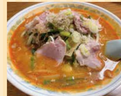
「坦々チャーシューメン」900円