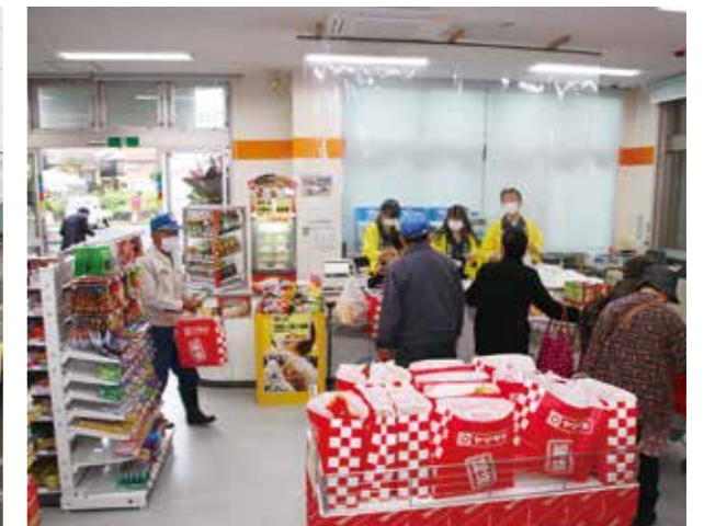
店内は多数の来店者で賑わいました