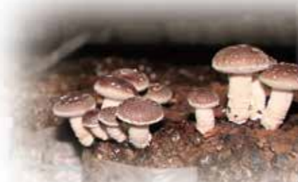
菌床しいたけ栽培は11年目