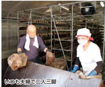
いつも夫婦で三人三脚

大友氏は戸沢村津谷地区で水稲6畝、菌床しいたけ3万菌床を栽培し周年を通じた農業を営んでおります。父から家業であった農業を継いで、今年で約45年目を迎えます。「昔は稲作が中心で冬期間は農業ができなかつたので、若いころは関東方面に長い間出稼ぎに行っていました。」25歳から土木関連会社で働き、以後約20年間も都内でタンクローリーの運転手を経験し、11年