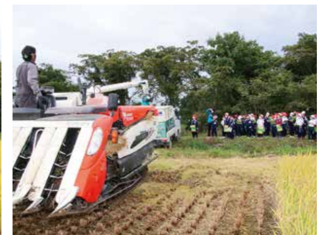
収穫され運搬する作業