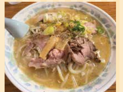
「みそチャーシューメン」850円