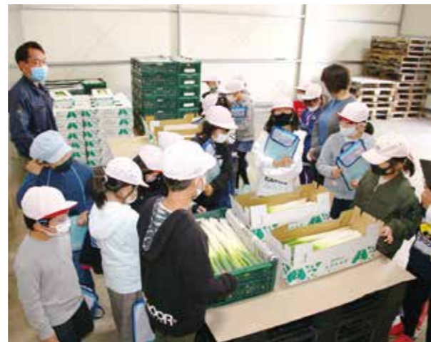
ねぎ選果場の予冷庫を見学