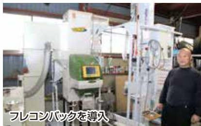
フレコンバックを導入