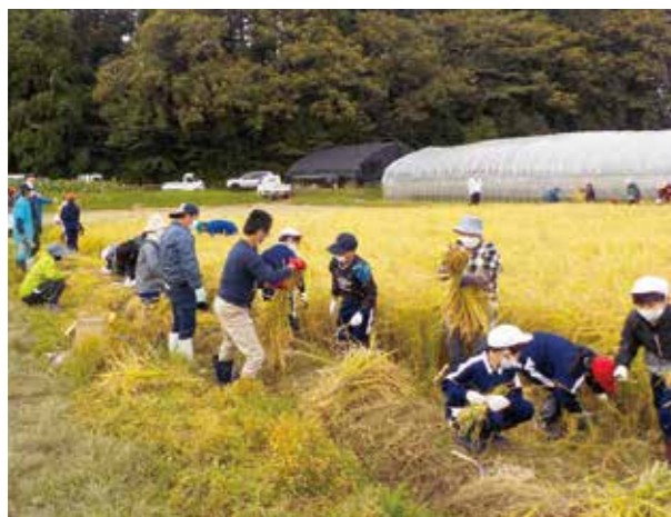
手作業による稲刈り体験

10月9日、大蔵小学校5年生35名が白須賀地区の実習田で、白須賀地区環境保全会とJA営農指導員の指導のもと稲刈りをしました。初めて稲刈り鎌を持つ児童もおり、皆さん楽しそうに秋の収穫を体験しました。