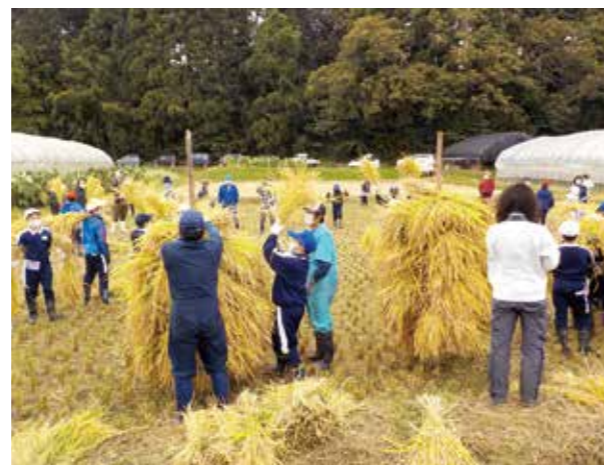
昔ながらの杭掛け作業