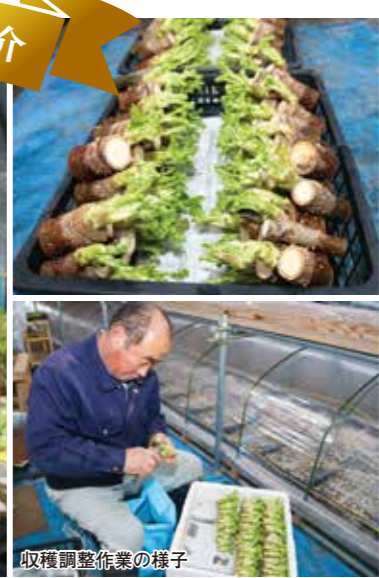
収穫調整作業の様子