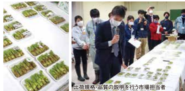
出荷規格・品質の説明を行う市場担当者

1月14日、協同の杜JA研修所で「たらの芽・うるい・ふきのとう」の目ぞろえ会が開催され、山形県や市場担当者、JA担当者約40名が参加しました。 山形県は全国有数の山菜産地であり、生産高日本を誇る「たらの芽」をはじめ、「うるい」や「ふきのとう」等、豊富な山菜を促成栽培しています。 県全体の目ぞろえ会を通し、県出荷規格にもとづく品質確認をおこない、意識統一、品質統一に努めてまいります。