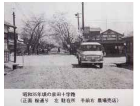
昭和35年頃の泉田十字路 (正面 稲通り 左 駐在所 手前右 農場売店)