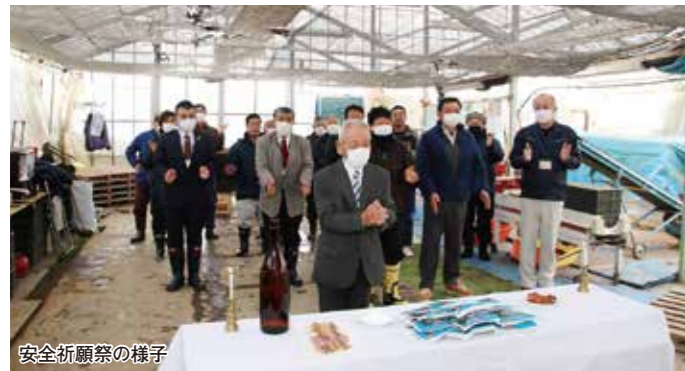
安全祈願祭の様子

最上子牛市場の新年安全祈願祭及び初セリが1月5日、新庄市の山形最上家畜市場で、生産者や行政、JA関係者約200名が参加し開催されました。 県内から雌牛87頭、去勢牛119頭の計206頭が上場され、新年の初セリで賑わいました。雌牛の平均落札価格は69万6418円、去勢牛は69万7603円、全体の平均落札価格は69万7100円での取引となりました。また、最高価格は去勢牛の110万9900円で、昨年の最高価格より約5%下回りました。 未だ新型コロナウイルス感染症の影響はありますが、相場はかなり持ち直しており、例年並みの価格で推移しています。