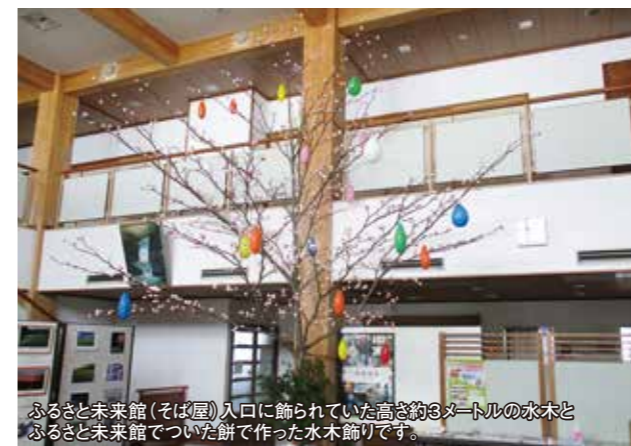
ふるさと未来館(そば屋)入口に飾られていた高さ約3メートルの水木とふるさと未来館でついた餅で作った水木飾りです。

今回の飾りを手掛けた村民の方より話を聞くと、昔はほとんどの家庭で水木と餅を用意し飾っていたとの話でした。