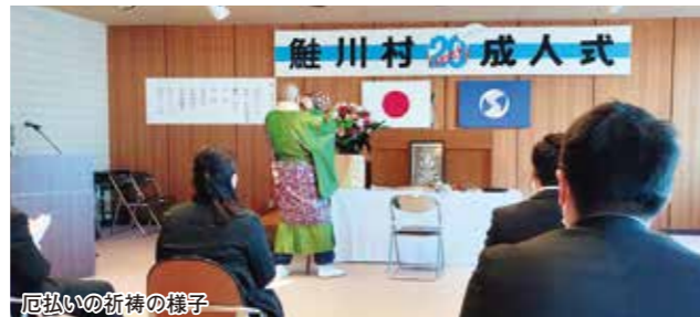
厄払いの祈祷の様子

式典では、村長あいさつに続き、出席者代表より「人口増加に貢献します」「たくさんの税金を納付します」と誓いの言葉が述べられました。