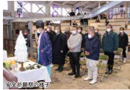
安全祈願祭の様子