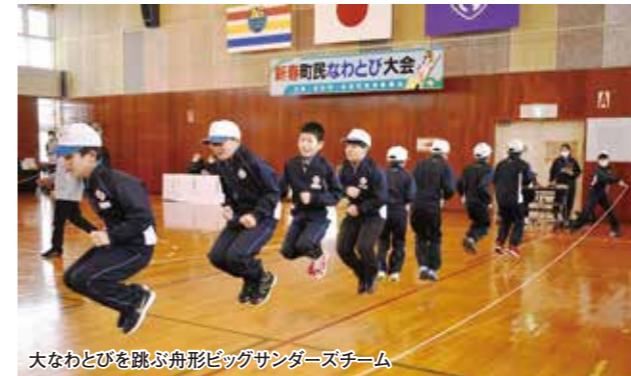
大なわとびを跳ぶ舟形ビッグサンダーズチーム

団体の部の競技は、長さ10メートルほどの長い縄を2名で回し、8名がタイミングを合わせて跳び、その回数を競うものです。