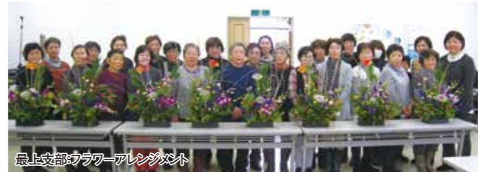
最上支部：フラワーアレンジメント

《最上支部》 フラワーアレンジメント講習会 12月24日、最上支部でフラワーアレンジメント講習会が佐藤花屋さんを講師に迎え、38名が参加し開催されました。