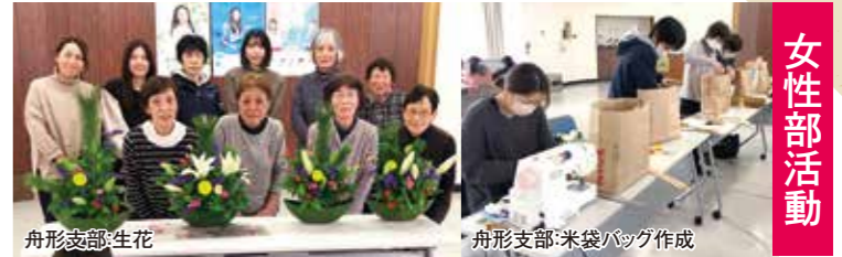
舟形支部：生花 舟形支部：米袋バッグ作成