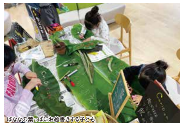
ばななの葉っぱにお絵書きする子ども

5月12日、第12回全国和牛能力共進会の山形県予備調査(最上・庄内地域)が最上家畜市場で開催され、生産者と関係者約30名が参加しました。 出品候補牛6頭の調査を行い出品技術などの指導が行われました。 候補牛は、7月13日に開催予定の山形県最終予選会に出品され、同予選会にて鹿児島会場出品牛および補欠牛を決定します。