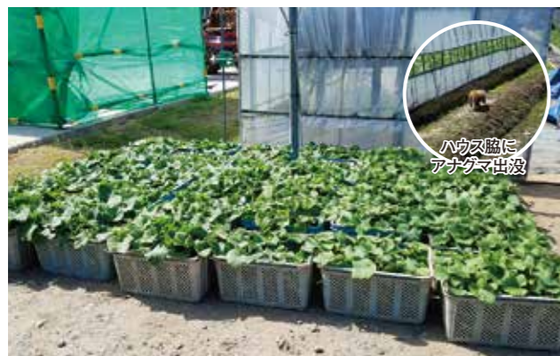
ハウス脇に アビゲマ出役