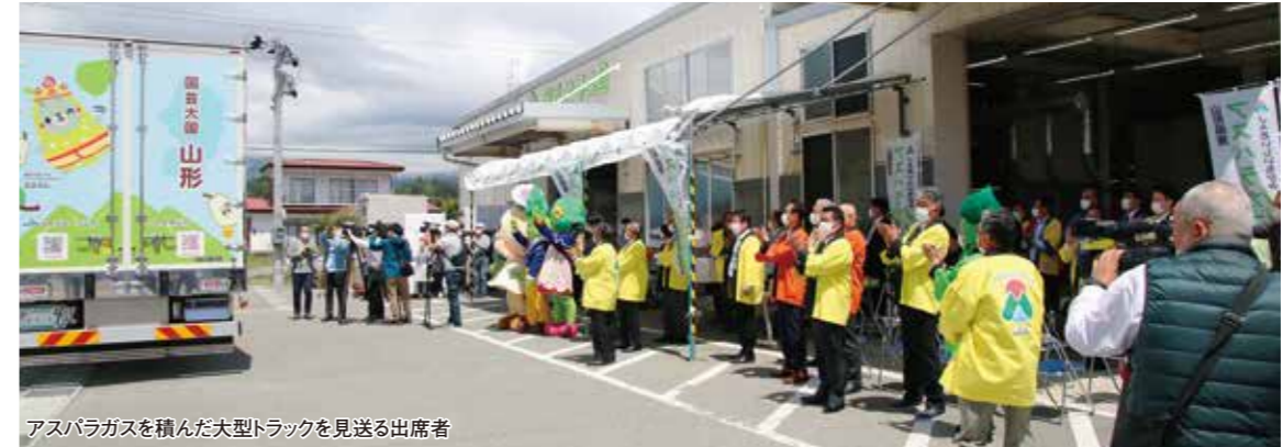
アスパラガスを積んだ大型トラックを見送る出席者