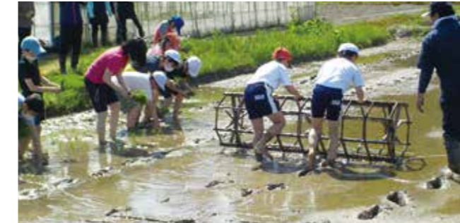
《大蔵営農センター 矢口渡》

白須賀地区保全会の皆様が中心となり、子供たちに農業の大切さを学んでもらおうと毎年行っているものです。児童たちが植えたのは「はえぬぎ」の苗で、農家に教わりながら2時間の水田に2時間かけて苗を植えていきました。10月頃に自分たちで植えた田んぼの稲刈りをするそうです。