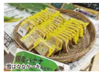
国産バナナ 雪はななケーキ

5月3・8日、ほんぽ館(戸沢村)で、Curioさん(新庄市にある洋菓子店)が制作した雪はななケーキ(雪はななを皮ごと使用した、パウンドケーキ)を販売しました。 また、隣接するバナナハウスの見学やばななの葉っぱにお絵書きコーナーなども設けられ、来店した子どもたちは夢中になってばななの葉っぱにお絵書きしました。