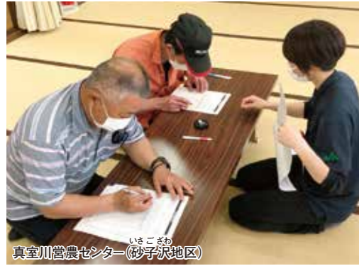
真室川営農センター(砂子沢地区)

5月中旬より、令和4年産米出荷契約が各営農センターで開催されました。米をめぐる状況については、厳しい環境が続いており、有利販売に取り組んでまいります。