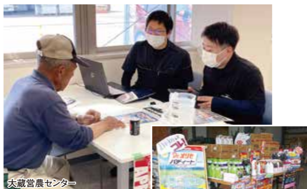
大蔵営農センター