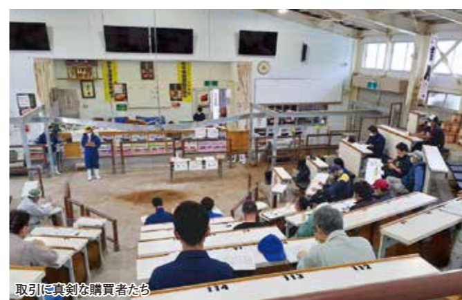
取引に真剣な購買者たち

農薬は水稲用初期除草剤と水稲用中期、一発除草剤から数種類を展示し、ご来店したお客様にJA職員と農薬メーカーが使用方法の注意点や効果など説明しました。