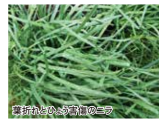
葉折れとひょう害のニラ

6月2日と3日、昨年に引き続き降ひょうで農作物に被害が発生しました。東部営農センター管内では被害が大きく、出荷最盛期を迎えたアスパラガスやニラに深刻な被害が発生しました。アスパラガスは約4700㎡、ニラは約1700㎡、ネギは約880㎡の被害面積となっており、茎折れや曲がり、葉折れなど出荷が困難な状況となりました。