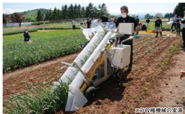
三刈収穫機械の実演

5月23日、大蔵・戸沢・鮭川営農センター管内の生産者を対象としたアスパラガスの目ぞろえ会が鮭川販売センターで開催され、生産者とJA担当者15名が参加しました。