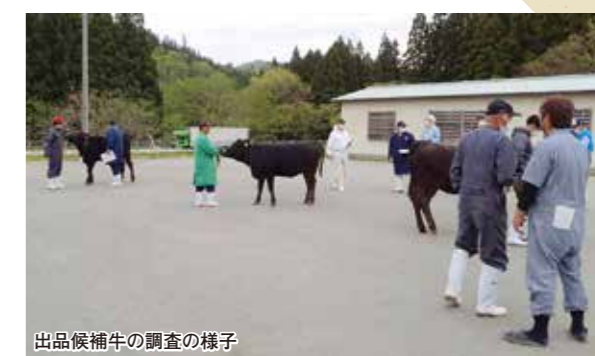
出品候補牛の調査の様子

5月12日、山形県は、肉用牛改良推進事業の候補種雄牛の取引会を開催し、関係者約50名が参加しました。 将来、山形県所有の優秀な黒毛和種の種雄牛の候補となる2頭が取引されました。1頭は、「美津勝桜号」でその産子が10頭。もう1頭は、「丸藤号」でその産子が6頭取引されました。当JAでも「美津勝桜号」の産子が3頭、「丸藤号」の産子3頭の出荷があり、今後購買者の元で肥育され、枝肉成績が優秀と認証を受ければ正式に県産種雄牛としてデビューする予定です。