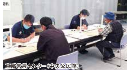
東部営農センター(中央公民館)