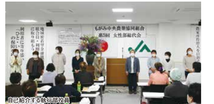
自己紹介する執行部役員