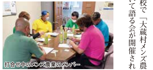
打合せ中のメンズ農業のメンバー

6月3日、大蔵中学校で「大蔵村メンズ農業」と大蔵村PRについて語る会が開催されました。 生徒は、「大蔵村の強みはなにか?」「大蔵村を効果的にPRするためにどんなことが必要だと思うか?」この2つの話について、「メンズ農業」のメンバーよりアイデアを聞いたり、自分の考えを発言していました。