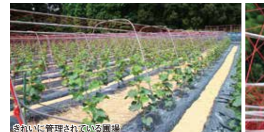
きれいに管理されている圃場