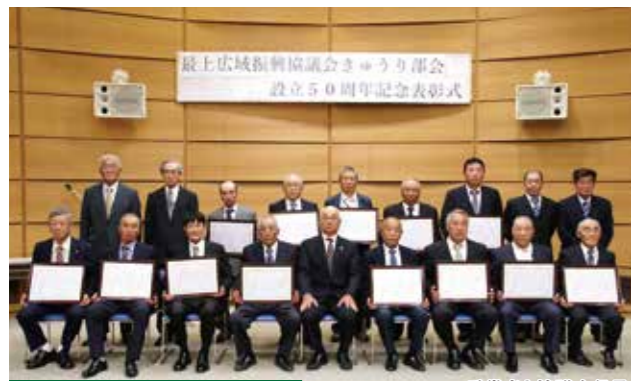
受賞者と協議会役員

「JAおいしいものがみブランド」全体での販売体制の強化を取引先市場役員へ要請しました。