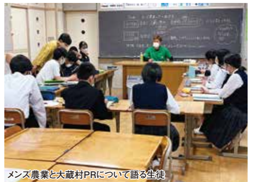
メンズ農業と大蔵村PRについて語る生徒

6月3日、大蔵中学校で「大蔵村メンズ農業」と大蔵村PRについて語る会が開催されました。 生徒は、「大蔵村の強みはなにか?」「大蔵村を効果的にPRするためにどんなことが必要だと思うか?」この2つの話について、「メンズ農業」のメンバーよりアイデアを聞いたり、自分の考えを発言していました。