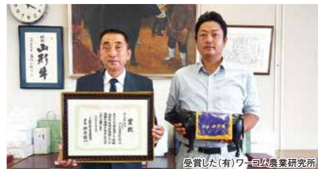
受賞した(有)ワーム農業研究所

6月17日、新庄市市民プラザで、最上広域きゅうり部会設立50周年を記念して、きゅうりの栽培に尽力されてきた16人に表彰状が贈られました。