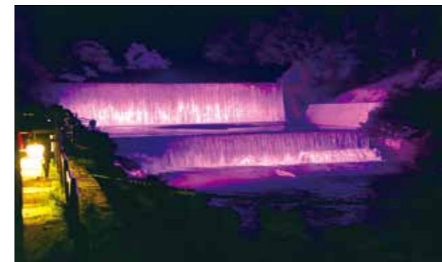
《大蔵営農センター 矢口渡》