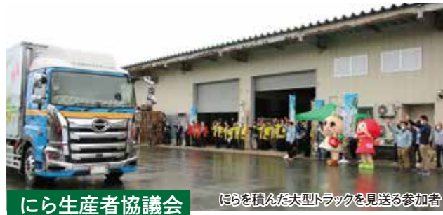
にら生産者協議会 にはらを積んだ大型トラックを見送る参加者