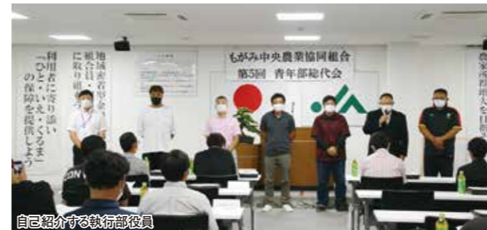
自己紹介する執行部役員