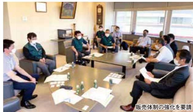
販売体制の強化を要請

同協議会の会員は233人で、約125畝を栽培し、生産量1604ト、販売額9億1600万円を目指します。