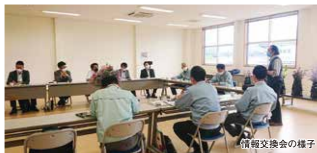
情報交換会の様子

6月20日、「JA総称山形牛枝肉共進会」が山形市の(株)山形県食肉公社で開催され、村山・最上地域から103頭が出品されました。